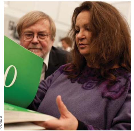
Ubiegłorocznymi ambasadorzy Targów Anna Dymna i Krzysztof Orzechowski

Autorka bestsellerowej serii o małym czarodzieju Harrym Potterze tym razem napisała powieść dla dorosłych. Polski przekład Trafnego wyboru – pełnej czarnego humoru, błyskotliwej i prowokującej opowieści o małym miasteczku – w księgarniach pojawi się z początkiem listopada. A już dziś wydawnictwo Znak zaprasza o g. 10.15 do sali 1 na konferencję związaną z premierą książki w Polsce.