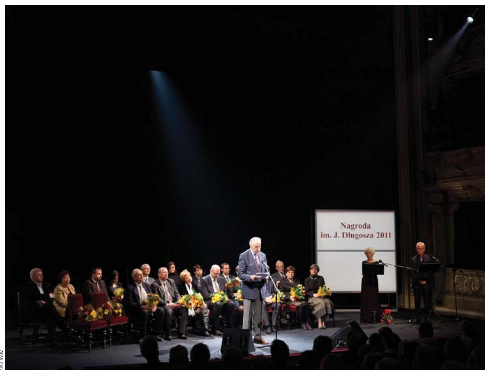
Nagroda im. Jana Długosza 2011. Przed ogłoszeniem werdyktu jury. Komu wyróżnienie przypadnie w tym roku?