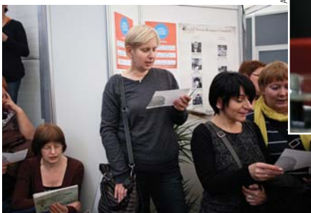
Targi 2011. Miłosz w samo południe

Pożegnanie z Afryką (przy przejściu z hali głównej do sektora F), a filmy z poszczególnych targowych dni będą publikowane na kanale youtube Targów.