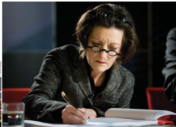
Targi 2010. Pierwsze zdanie Herty Müller

W 2010 roku uczestnicy Targów oraz autorzy pisali książkę razem z noblistką Hertą Müller, w 2011 czytali wiersz Czesława Miłosza na tysiące głosów, a w tym roku nakręcą wspólnie film, w którym opowiedzą przed kamerą, jak interpretują hasło przewodnie 16. edy-